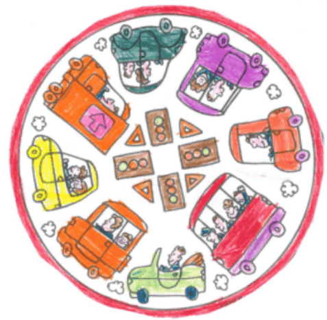
Kleurplaat: Laura Das

Na de uitleg mochten de kinderen hinkelen, stoepkrijten, skippyballen, bliklopen en op kleine skeltertjes naar hartenlust spelen op de stoep. Dit werd met veel plezier gedaan. Aangekomen in de speeltuin bij het Diepven kregen de kinderen ook hier eerst weer uitleg over de verkeersregels in een speeltuin zoals nooit de straat op rennen (bijvoorbeeld achter een bal), opletten bij de schommels, niet duwen bij de glijbaan. Na uitleg van de regeltjes mochten de kleuters heerlijk, vrij en veilig spelen in de speeltuin. "Alles was heel erg leuk, vooral de spelletjes op de stoep en Cool dat ik in het hoge klimrek mocht" aldus een van de kleuters na afloop.