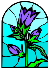
Campanula trachelium I.

Na de carnavalsvakantie starten de groepen 5 met ‘presenteren’. In de week voorafgaand aan de vakantie krijgen ze twee keer een weektaaktijd om zich goed voor te bereiden. Deze voorbereiding gaat ook mee naar huis. Dinsdag 14 februari geven we schriftelijk informatie mee voor u als ouder. Succes allemaal!